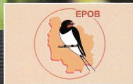
Étude des oiseaux en Bourgogne