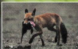
Les nuisibles !