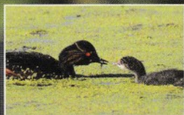
Grèbe à cou noir