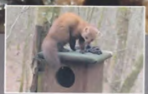
Régime alimentaire de la Martre