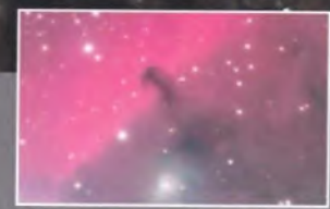
Nébuleuse de la Tête de Cheval