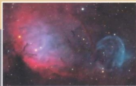
Imager un trou noir