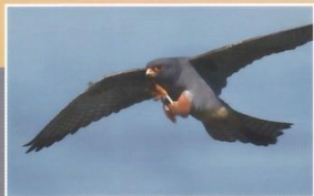
La chasse des faucons