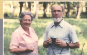
Centenaire de Bugnon