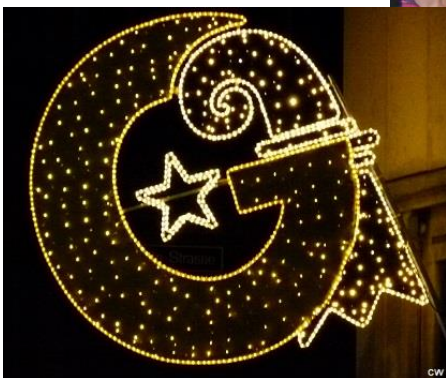
Herrade Nehlig - Rieb