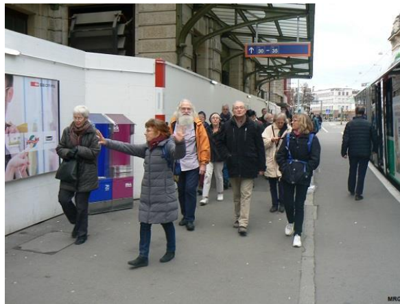
arrivée à Bâle

Pour commencer notre superbe sortie à Bâle, trajet fort sympathique en train, magnifiquement organisé par notre secrétaire Marie-Roberte, puis petite balade apéritive dans les rues de Bâle selon 2 schémas :