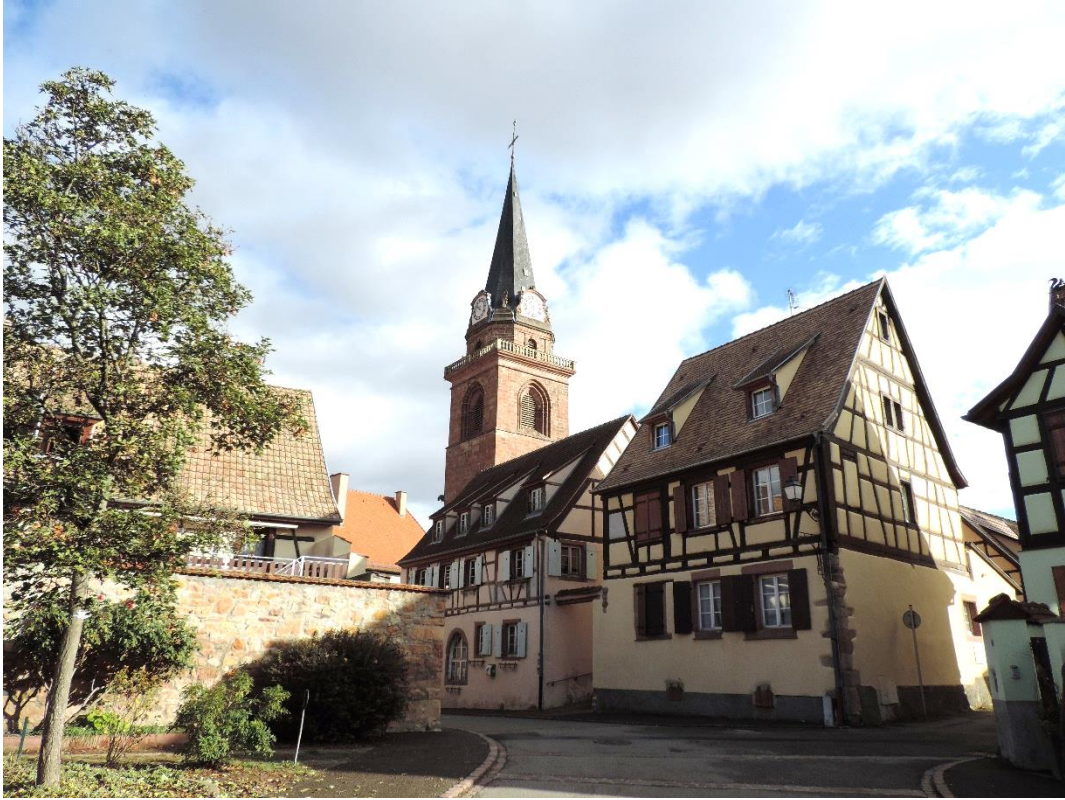
Vue de l'église depuis la rue des Vignerons

Nous visitons également l'ancienne synagogue et découvrons les trésors cachés dans les ruelles, avec notamment les nombreux décors de maisons jadis occupées par des habitants juifs, puisqu'autrefois cette communauté atteignait 30% de la population. Des explications de Jean-Pierre Lambert nous éclairent opportunément sur ce sujet qu'il maîtrise si bien.