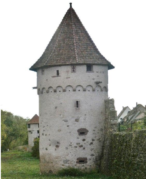
Tour de la Poudrière