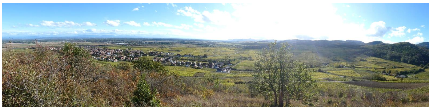
Panorama sur Bergheim

A partir de là, nous explorons les pelouses sèches du Grasberg géré depuis 1988 par le Conservatoire d'Espaces Naturels d'Alsace.