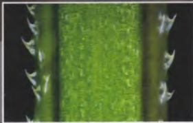
Plantés mais pas désarmés