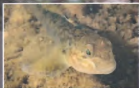
Gobie à tache noire