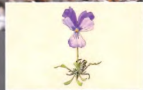
Violette de Cry