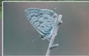
Le Petit Azuré porte-queue