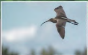
La gestion adaptative des espèces

Cohabitation • Plus-value écologique • Gestion des cours d'eau