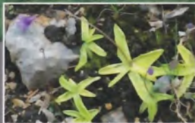
Le carnivorisme de la Grassette