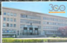
Faculté des Sciences